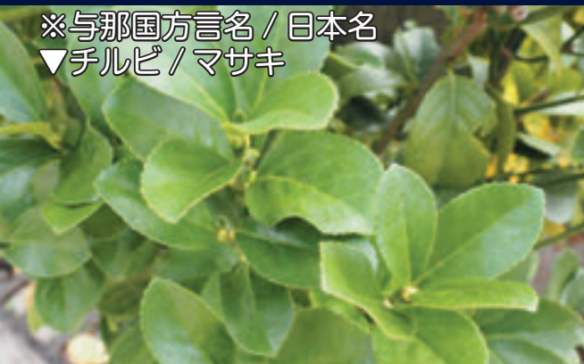
※与那国方言名 / 日本名 ▼チルビ / マサキ

祈願が行われる場面には、よくハナとして供えられるチルビ（マサキ）をはじめ、様々な植物が使われています。その中には、タナドゥリに使われるドゥシキ（ススキ）など、その植物の特徴と願いの意味を重ねて、供えられるものもあります。