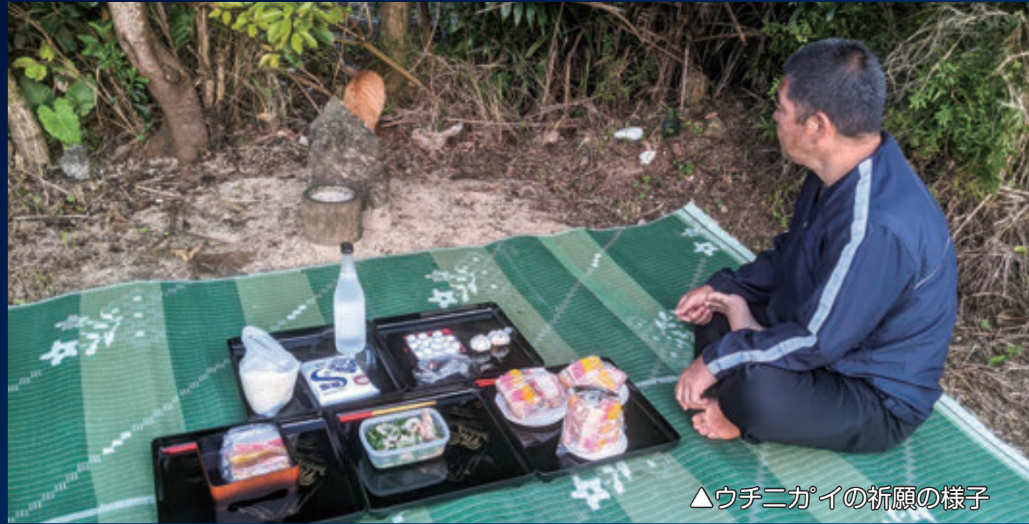
▲ウチニガイの祈願の様子

一年に六回、己亥の日に行われます。各公民館（久部良自治公民館をのぞく）は、所有する獅子とともに、亥の方角（北西よりやや北）に向き、島の安泰、島人の健康などを祈願します。