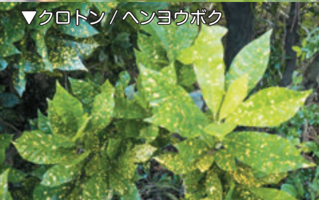
▼クロトン / ヘンヨウボク