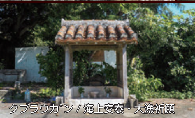
クブラウカン / 海上安泰・大漁祈願