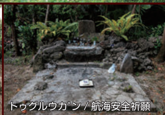
トウグルウカン / 航海安全祈願