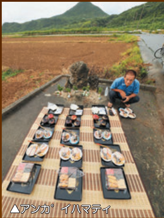
▲アンカ°イハマティ