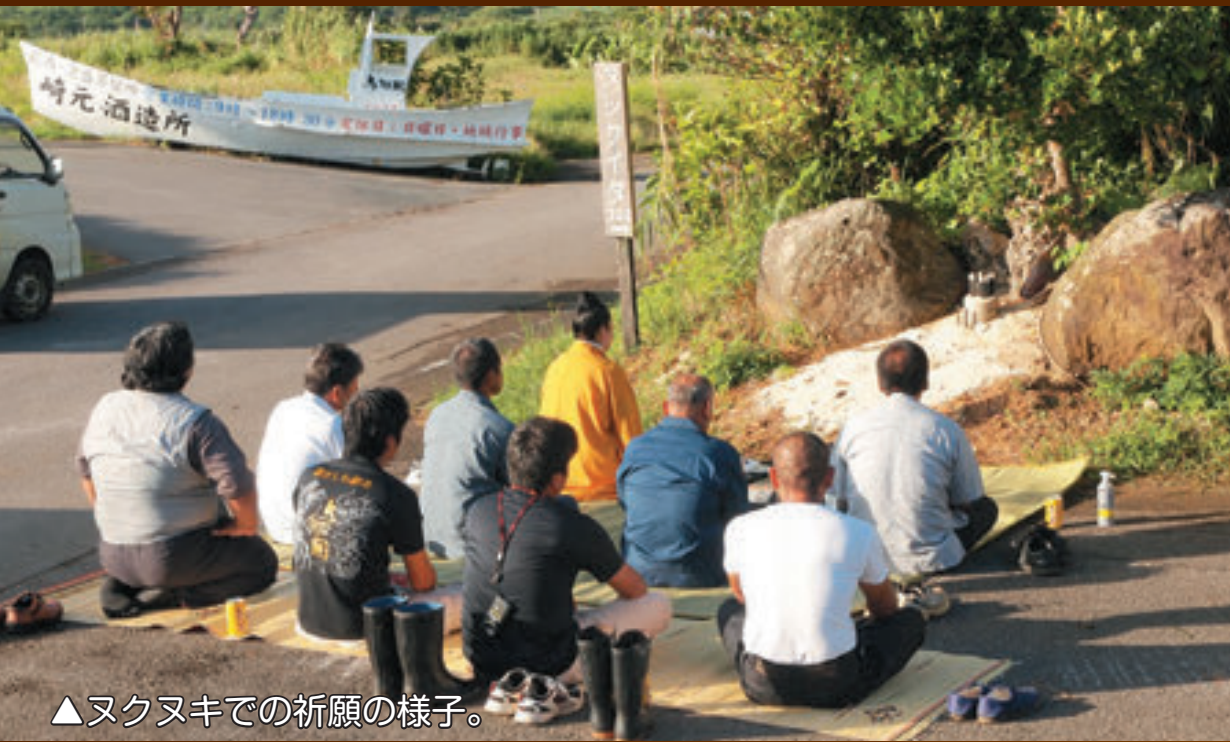
▲ヌクヌキでの祈願の様子。