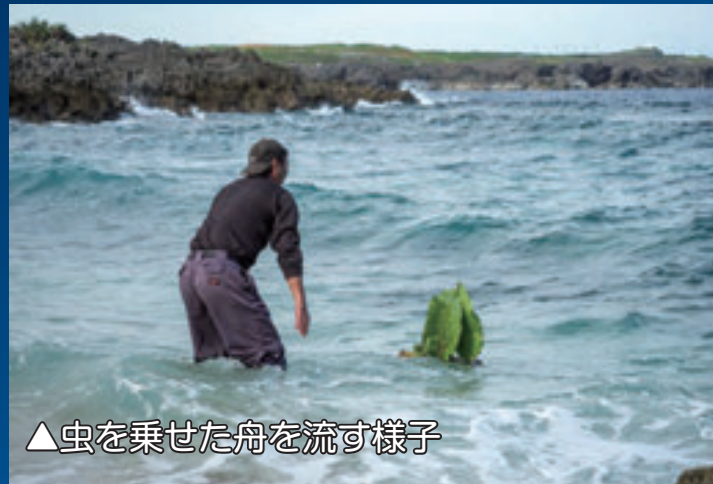
▲虫を乗せた舟を流す様子

祈願の後は、島にある作物が虫に食べられないように、害虫を捕まえて、「ピンクイ（クワズイモ）」の葉で包んだものを、「ばす（芭蕉）」の幹で作った船の上に乗せて海へ流します。その際「あんどめちま（理想郷）へ行きなさい」と言い聞かせて送ります。