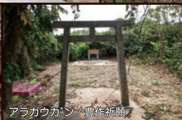
アラウカン / 豊作祈願