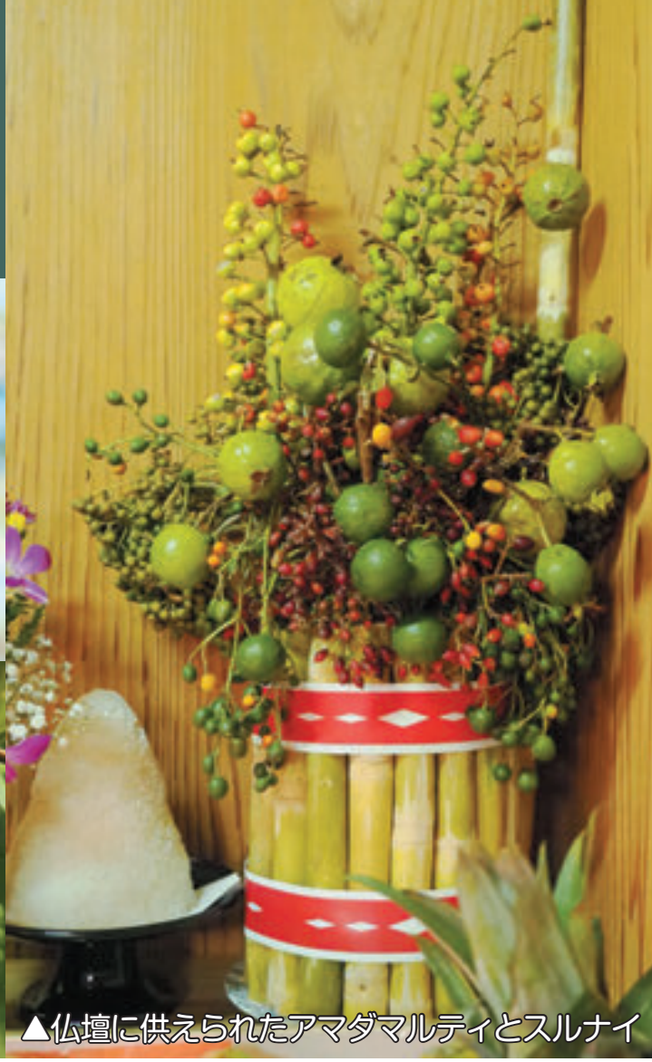
▲仏壇に供えられたアマダマルティとスルナイ