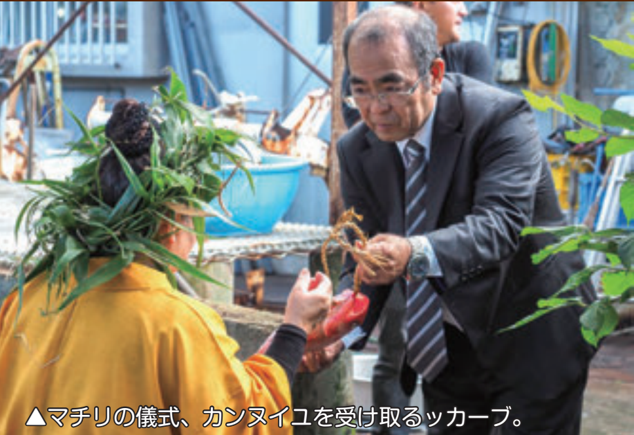
▲マチリの儀式、カンヌイユを受け取るツカーブ。

マチリは、島の祭事の中でも、長期間で盛大かつ厳かな雰囲気の中、旧暦 10 月・11 月の庚申の日から甲申までの、25 日間に渡り行われます。この期間は、「カンブナガ（神の節）」ともいわれ、精進のために四つ足の獣肉を食することや屠殺を行いません。祭事は、クブラマチリ（久部良自治公民館による異国人・大国人退散の祈願）から始まり、ウラマチリ（東自治公民館による家畜繁盛の祈願）、ンディマチリ（比川自治公民館による子孫繁栄の祈願）、ンマナガマチリ（嶋仲自治公民館による五穀豊穡の祈願）、ンダンマチリ（西自治公民館による航海安全の祈願）、という順で、それぞれの祈願が 5 つの公民館のもと行われます。最後はアンタドゥミを行い、ンヌン（太鼓）とカニ（ドラ）を鳴らして島をまわり、マチリが明けたことを知らせます。