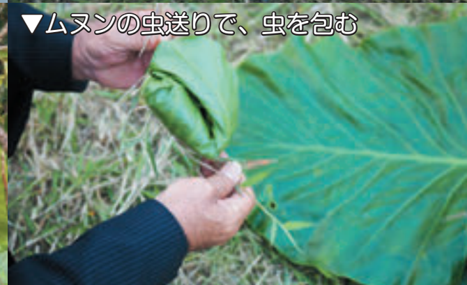
▼ムシの虫送りで、虫を包む