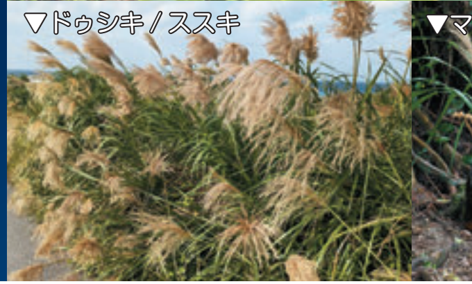
▼ドゥシキ / ススキ