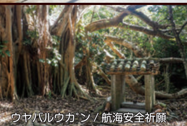
ウヤバルウカン / 航海安全祈願