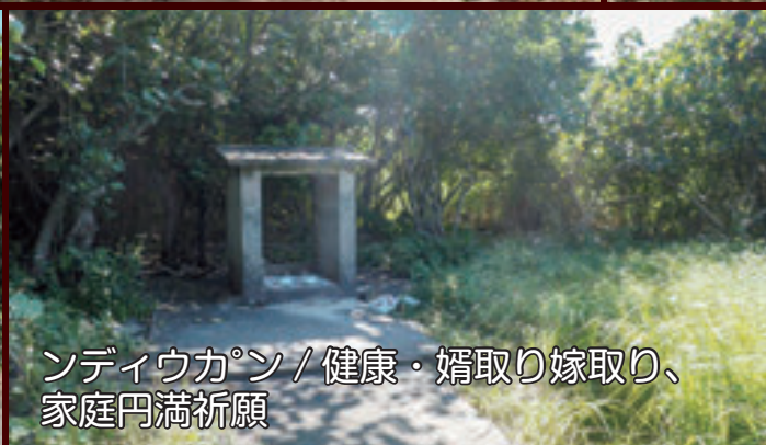
ンディウカン / 健康・婿取り嫁取り、家庭円満祈願