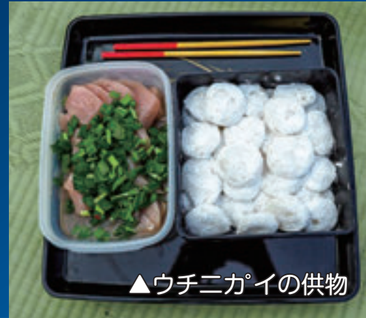
▲ウチニガイの供物

ウチニガイは、牛への感謝と健やかな繁栄を祈る祭事です。供物の特色として、ウチニカウムティティ（牛願いの小さな餅）と刺身をニラとカチダイ（泡盛の酒粕）で和えた物があります。ウチニカウムティティは、直径三センチほどの生餅をぎっしり重箱に詰めたものです。現在では見なくなりましたが、昔は、餅を子牛の角に刺していました。多数の小餅や、旺盛な生命力で増えていくニラやニンニクに、家畜の繁栄を願う思いが象徴的に示されています。