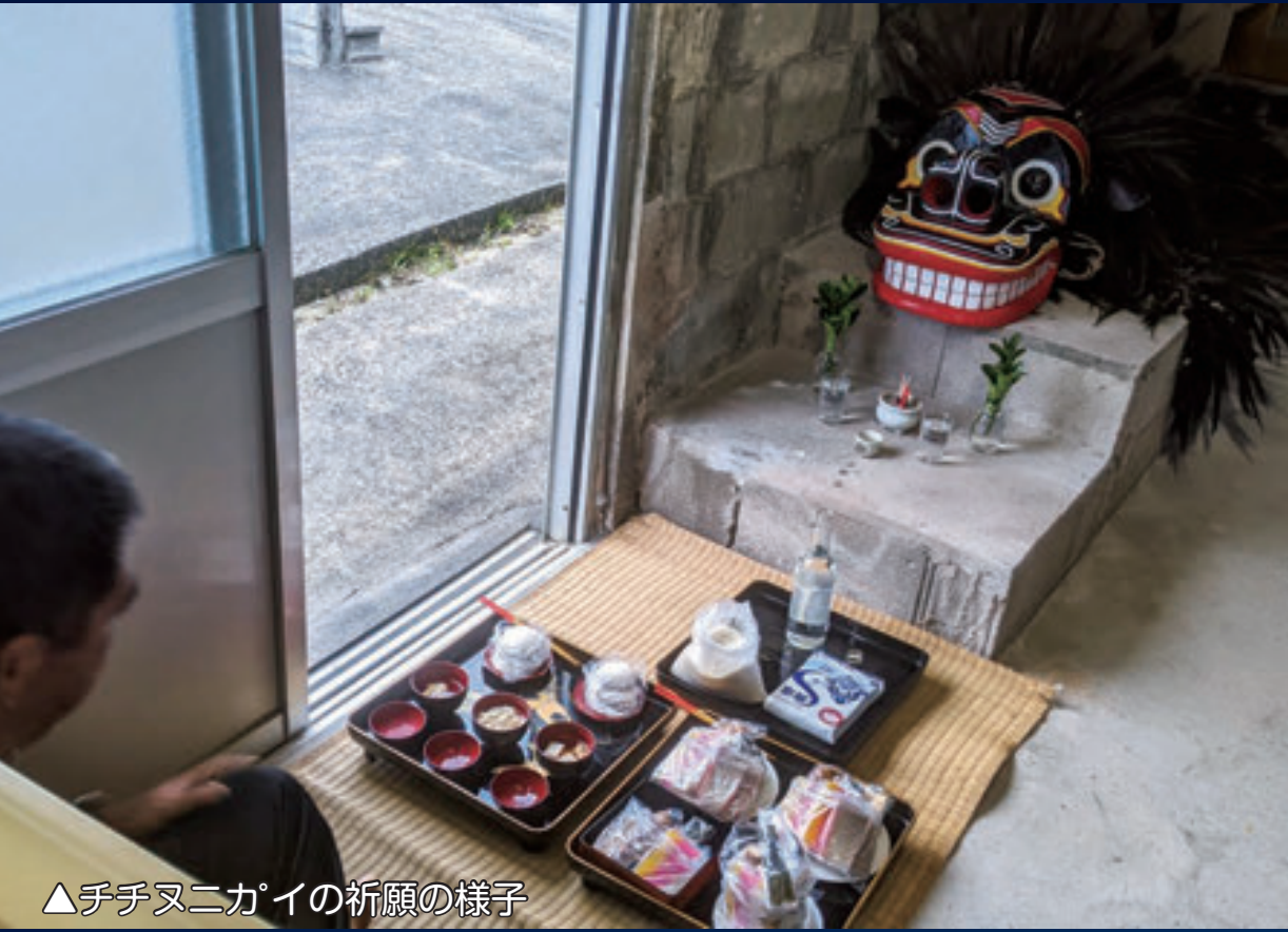
▲チチヌニガイの祈願の様子

公民館が執り行うムラのウチニガイは、旧暦八月と二月の甲乙の日に行う。個人家庭でのウチニガイは翌日、乙丑の日に行う。