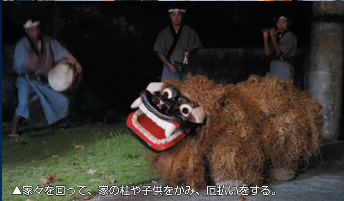
▲家々を回って、家の柱や子供をかみ、厄払いをする。