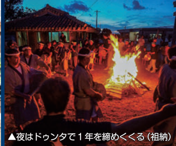
▲夜はドゥンタで1年を締めくくる（祖納）