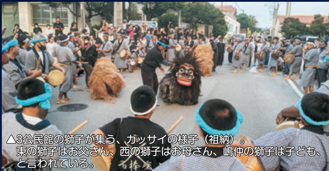
▲3公民館の獅子が集う、ガッサイの様子(祖納)。東の獅子はお父さん、西の獅子はお母さん、島中の獅子は子ども、と言われている。