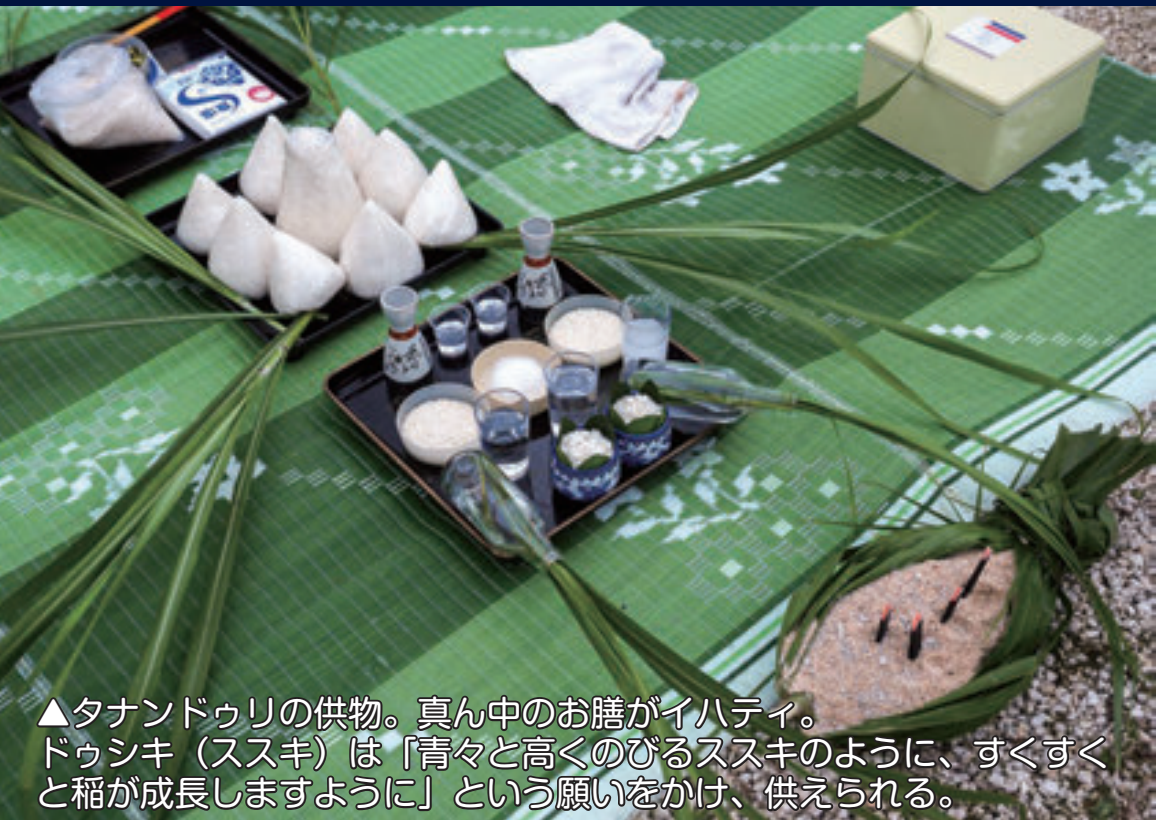
▲タナンドゥリの供物。真ん中のお膳がイハティ。ドゥシキ（ススキ）は「青々と高くのびるススキのように、すくすくと稲が成長しますように」という願いをかけ、供えられる。

タナンドゥリやムヌンなどの農耕儀礼は、島の人々の生活に稲作が重要とされていた頃から、稲作農家の一大行事として続けられてきました。タナンドゥリ（種取り祭、旧暦2月甲乙）から始まり、カドゥムヌン（物忌み祭、旧暦2月庚辛）、ツァバムヌン（草葉物忌み祭、旧暦3月壬癸）、フームヌン（穂物忌み祭、旧暦4月庚辛）、ドゥムヌムヌン（世の、島の物忌み祭、旧暦5月戊己）と続き、種取りから収穫まで作物が順調に成長するように、その過程ごとに祈願が行われます。