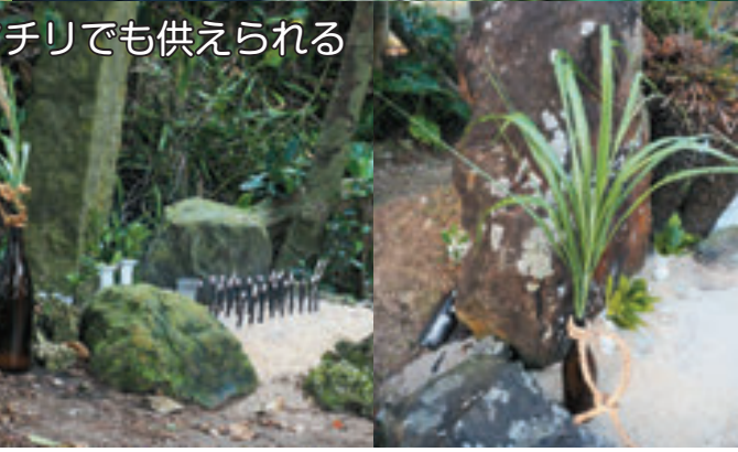
▼マチリでも供えられる