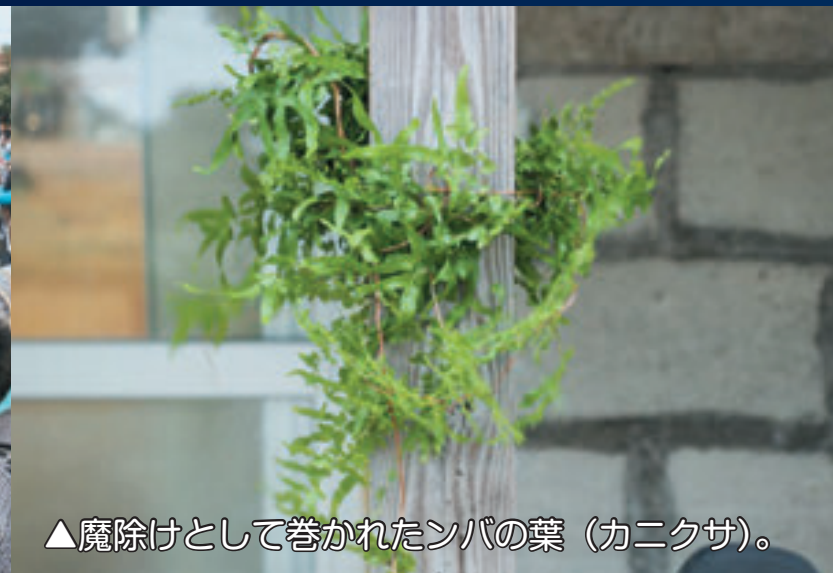
▲魔除けとして巻かれたンバの葉(カニクサ)。