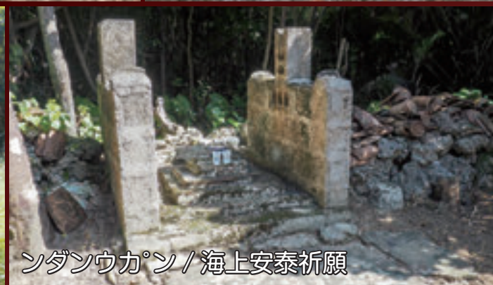
ンダンウカン / 海上安泰祈願