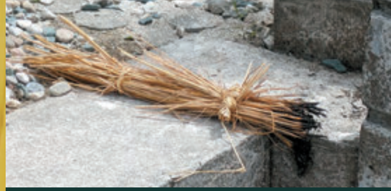
▲迎え火のチントウ お墓へ行き線香を立て、御先祖様をお迎えした後、藁で作ったチントウに火をつけて、我が家にお迎えします。