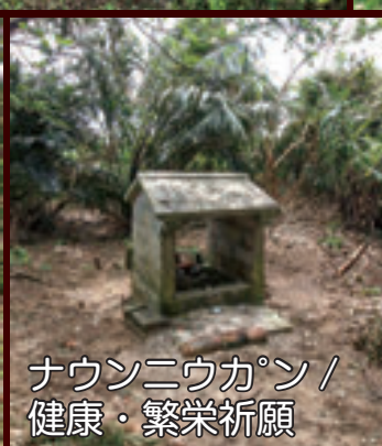
ナウンニウカン / 健康・繁栄祈願