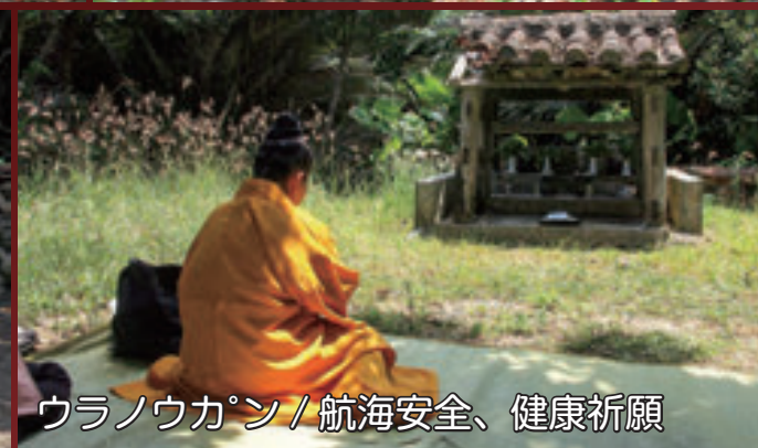
ウラウカン / 航海安全、健康祈願