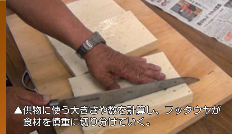
▲供物に使う大きさや数を計算し、フッタウヤが食材を慎重に切り分けていく。

「フッタ」とは包丁の意味で、「フッタウヤ」は、総料理長のこと。マチリに使われる食材を切り、供物を作る作業は、フッタウヤを中心に行われる。