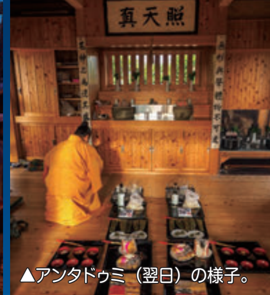
▲アンタドゥミ（翌日）の様子。