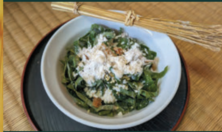
▲悪霊払いのミディヌク 実のなる野菜の葉とアマダ(サトウキビ)の若芽など、7種類の葉を刻んだものと、焼いた粟、小麦粉やモチ粉などをふりかけて作り、仏壇の御馳走のそばに置いておきます。