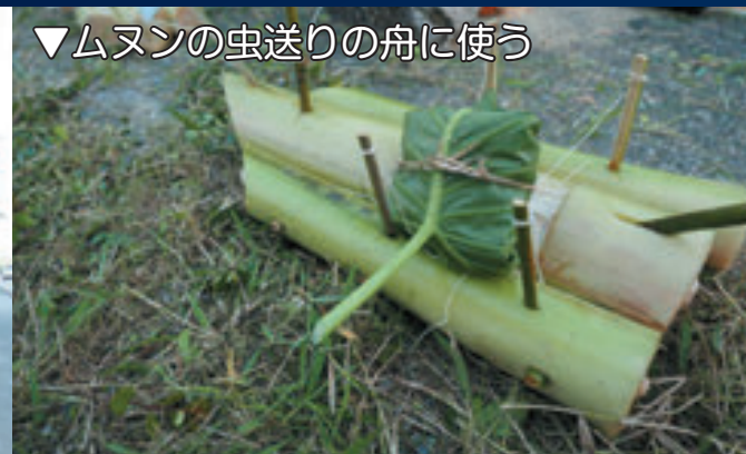
▼ムシの虫送りの舟に使う