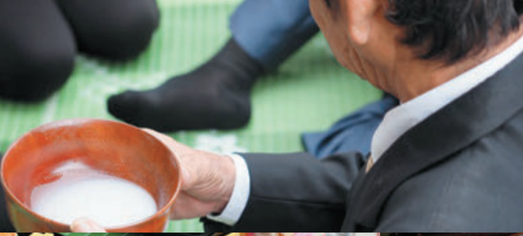
▽ナガダラ（中碗）に注がれたミティ。米を砂糖とやわらかく炊き発酵させて作るお神酒。