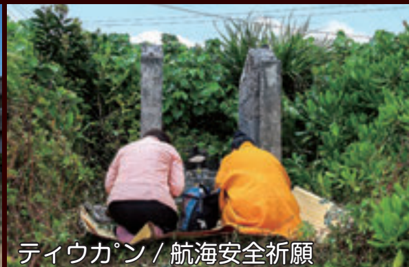
ティウカン / 航海安全祈願