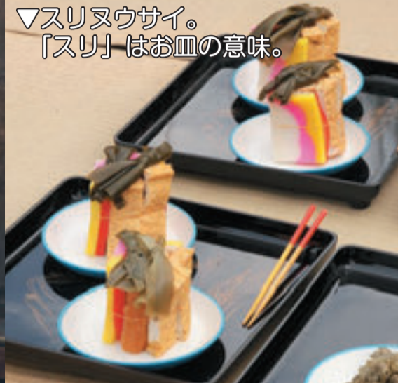
▽スリヌウサイ。「スリ」はお皿の意味。