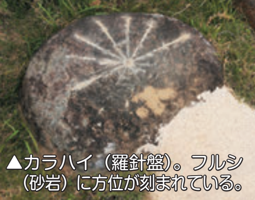
▲カラハイ(羅針盤)。フルシ(砂岩)に方位が刻まれている。

「屋手久(ダティク)という地の小高い丘(チディ)」を意味するその場所は、航海安全を祈願する拜所となっており、かつては、船の出入を見届けるための火番小屋として、番人は松明を灯したり遠見の監視など、灯台や通報の役目を担う場所でした。「ダティグクイ」の「クイ」は「建てる、作る」という意味で、年に一度番小屋を建て改めていましたが、現在ではこの日に航海安全の祈願が行われています。ダティクチディは、当時の対外関係が語られる重要な史跡として、平成19年より国指定史跡となっています。