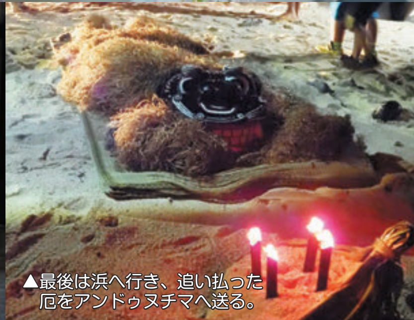
▲最後は浜へ行き、追い払った厄をアンドウヌチマへ送る。