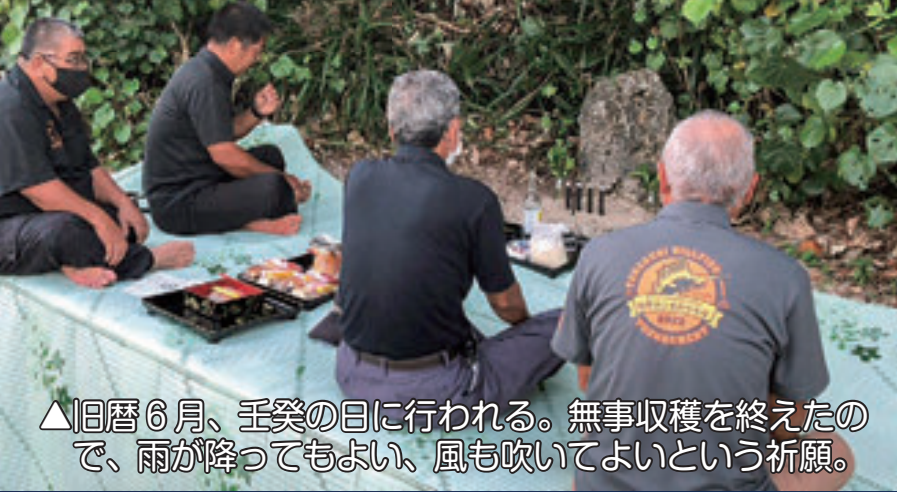
△旧暦6月、壬癸の日に行われる。無事収穫を終えたので、雨が降ってもよい、風も吹いてよいという祈願。