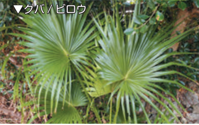
▼クバ / ビロウ