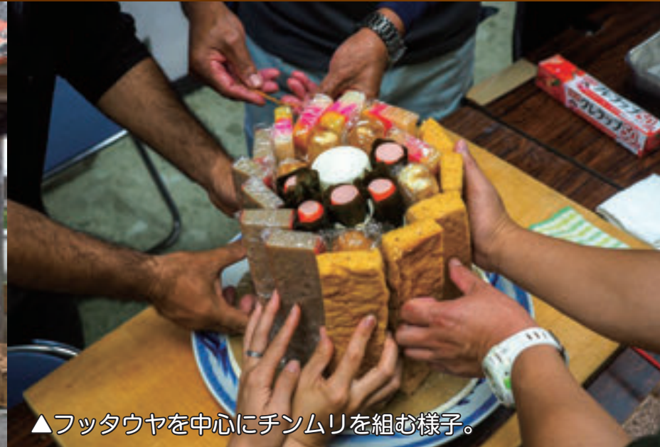
▲フッタウヤを中心にチンムリを組む様子。