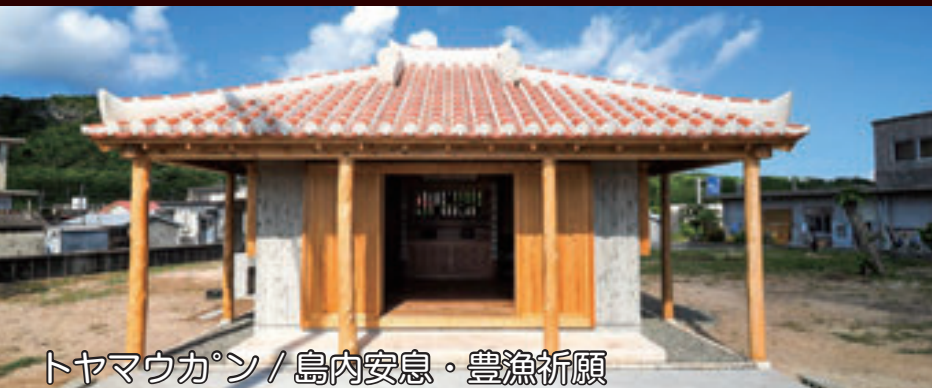
トヤマウカン / 島内安息・豊漁祈願

御嶽は島のことばで「ウカン」といいます。人々の暮らしが多くの自然環境に左右されてきた時代から、今も様々な祈りが行われている大切な場所です。島には 13 箇所の御嶽がありますが、旧村跡など自然に囲まれた場所にあるため、放置されたままだと退廃してしまうかもしれません。しかし、今後も祭事を行い続けることで、ウカンの環境が守られ残していくことができるはずです。訪れる際には、礼、挨拶をし、敬う心で臨みましょう。