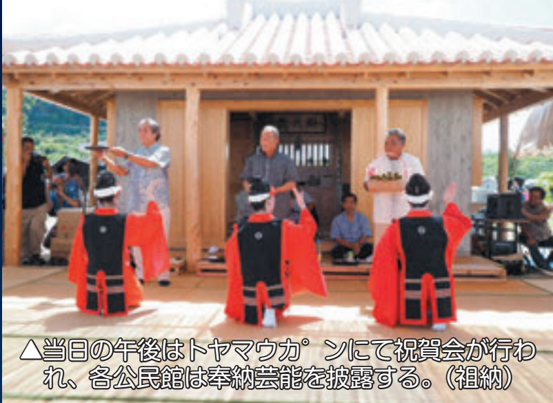
△当日の午後はトヤマウカ ン にて祝賀会が行われ、各公民館は奉納芸能を披露する。（祖納）