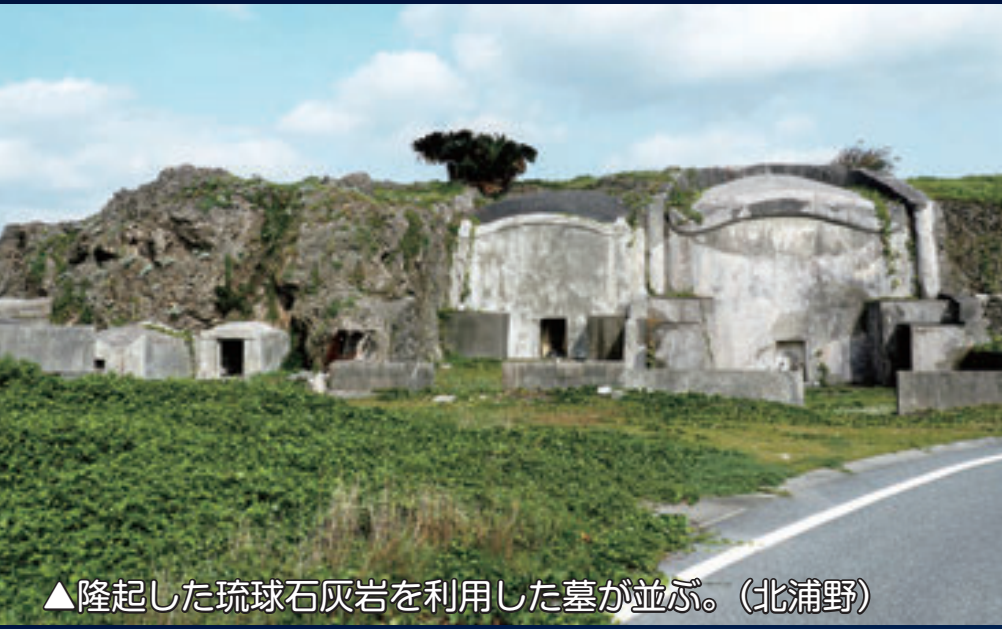
▲隆起した琉球石灰岩を利用した墓が並ぶ。（北浦野）

✧にんばら（北浦野） 彩る植物✧ 2～3月頃になると見られる植物たち。探してみよう。