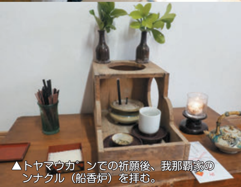
▲トヤマウカ°ンでの祈願後、我那覇家のンナクル(船香炉)を拜む。