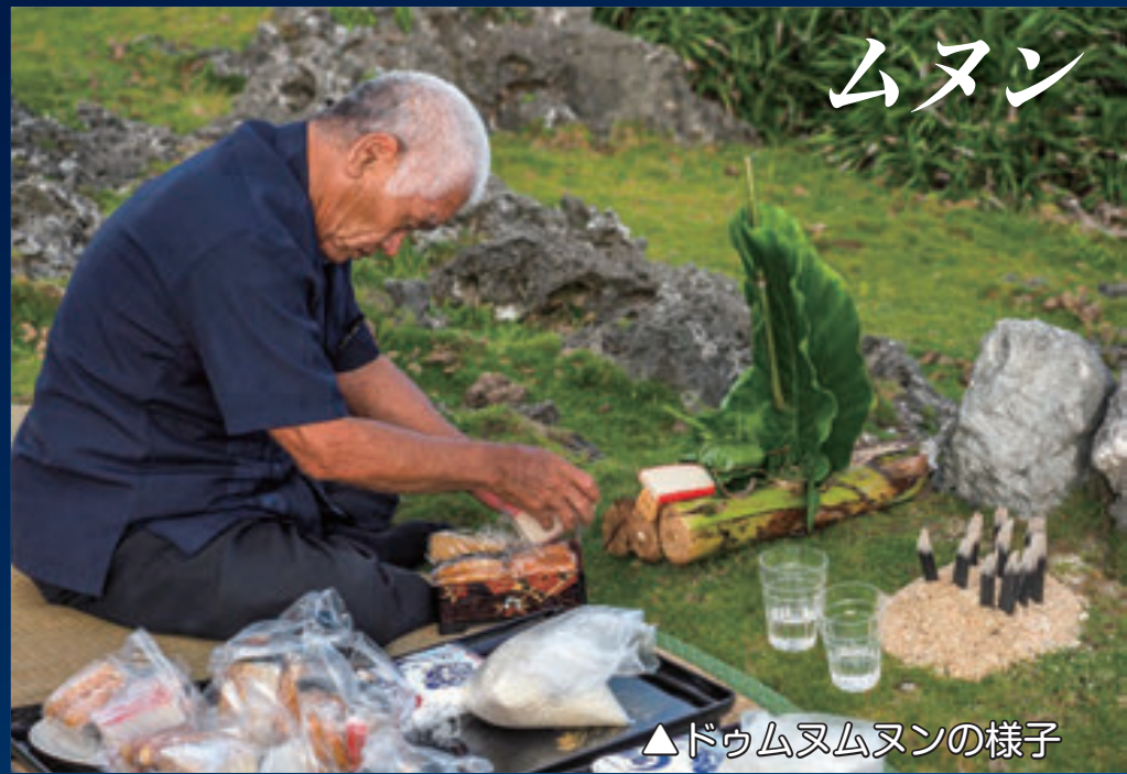
▲ドゥムヌムヌンの様子

タナンドゥリは、稲作の苗代に稲の成長を祈る祭事です。「今日時く種は一粒も間違いなく、犬の毛の様に、猫の毛のように順調に成長し、田植えとなれば大田（ウダ）中田（ナガタ）に植え余り、皆にもいきわたるよう苗を成長させてください。」と祈ります。現在は祖公連により行われ、祈願の際は、線香や供物が宇良部岳に向くように並べられます。