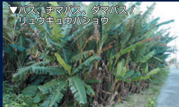
▼バス、チマバス、ダマバス / リュウキュウバショウ