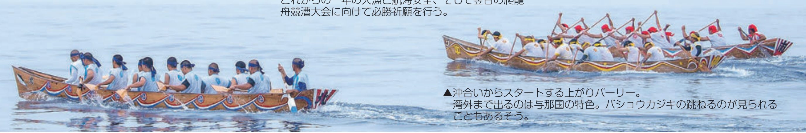
▲沖合いからスタートする上がりバーリー。湾外まで出るのは与那国の特色。バショウカジキの跳ねるのが見られることもあるそう。