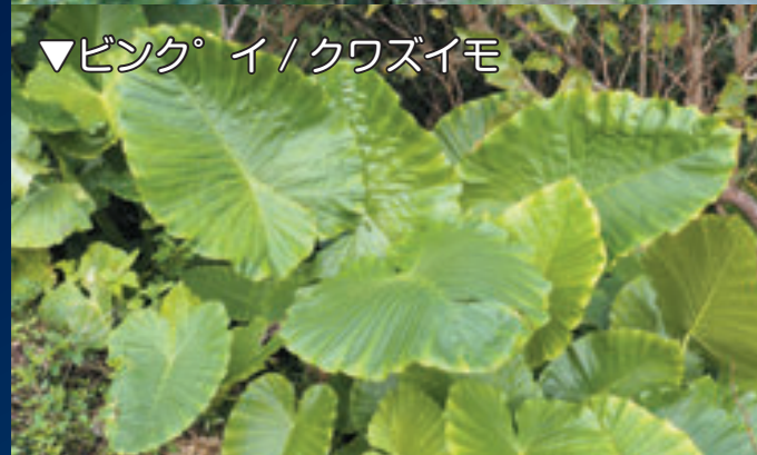
▼ピンク°イ / クウズイモ