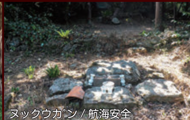
ヌックウカン / 航海安全