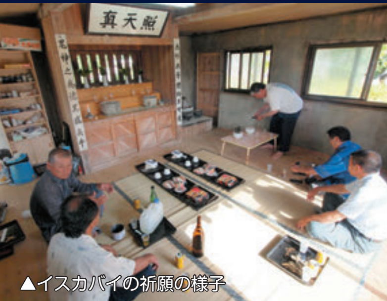
▲イスカバイの祈願の様子

旧暦の8月、9月にあたる己亥の日はシテイといい、チチ(獅子)の神様をお迎えし、島内の厄を追い払い、清める祭事を行います。魔よけ・厄よけとして、家の門や柱や立木や水まわり、乗り物などにンバ(カニクサ)を巻き付けます。