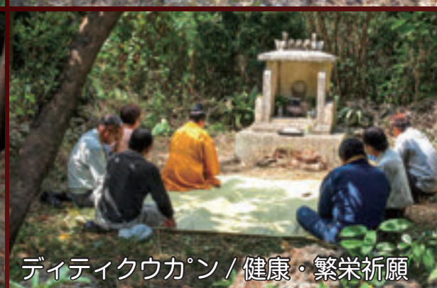
ディティクウカン / 健康・繁栄祈願