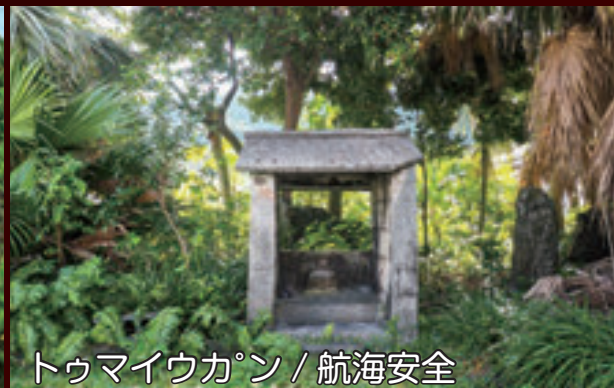
トウマイウカン / 航海安全