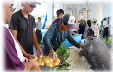
大会名物カジキの丸焼き仕込み中