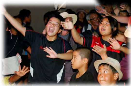
歌って踊って大盛り上がり