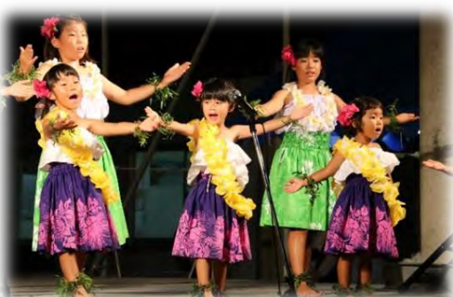
子どもたちよるフラダンスショー