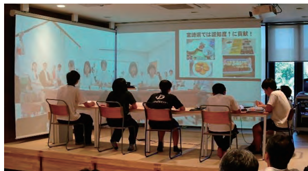
※模擬授業イメージ

合わせて、秋には ICT 技術を活用して学校間での合同学習授業を開催し小中学校の複式化解消を目指しますので、町民の皆様のご理解とご協力をよろしくお願い致します。