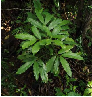
オオバルリミノキ (ビギダシカ)