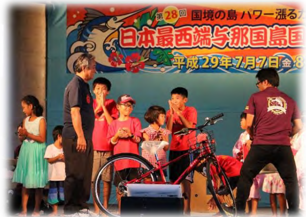
町長、僕に自転車があたりますように