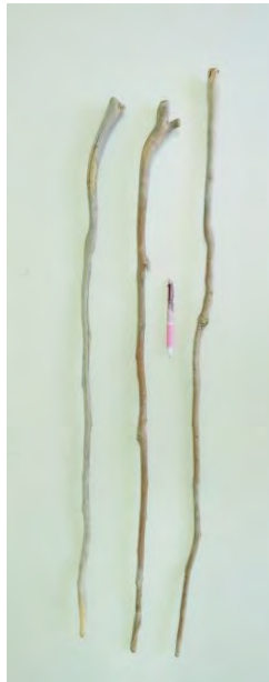
ダシカで作られた杖ダシカグサン。

製作の依頼が多いのは、ミニチュアサイズのクバガサとダシカクディのセット。魔除けのお守りとして、とても喜ばれるそうです。しかし、最近ではダシカの木を知る人が少なくなっており、材料の調達も難しくなっていることが悩みの種です。