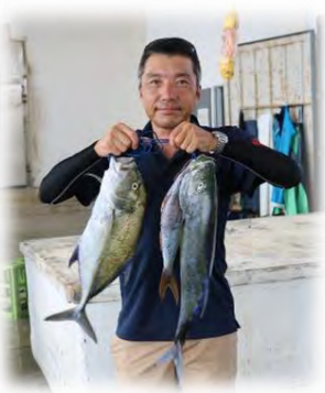
磯釣りの部 大漁です