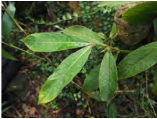
タイワンルリミノキ (ミーダシカ)

ダシカの木には、魔除けの力が秘められているという。木片の両端を鋭く尖らせたダシカクディ(ダシカの釘)を十字に結んで軒先などに吊るし、魔除けにする。