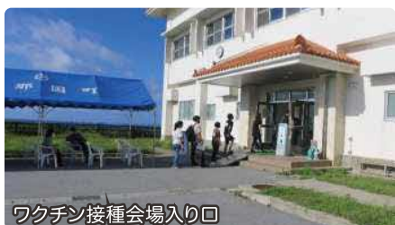
ワクチン接種会場入り口

未接種者や今後新たに接種対象となる方において、ワクチン接種を希望される方は長寿福祉課までご相談ください。また、第3回目の追加接種については、現在接種計画を策定中のため内容が決まり次第、公表いたします。