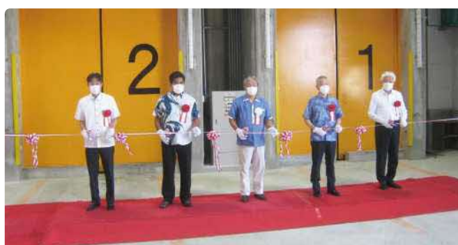
(記念式典 テープカットの様子)

町民の皆様におかれましては、各家庭から排出されるごみの減量・分別に対する特段のご理解とご協力を引続きお願いいたします。