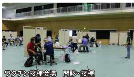
ワクチン接種会場 問診・接種