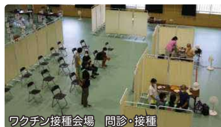
ワクチン接種会場 問診・接種