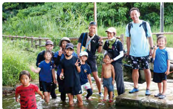
◀ 水質調査、頑張りました!