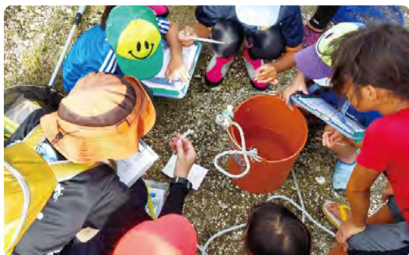
◀ 検査キットで測定中